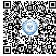
ចុះឈ្មោះតាមគេហទំព័រ ទាញយកកម្មវិធីទូរសព្ទ ឯកសារមេរៀន