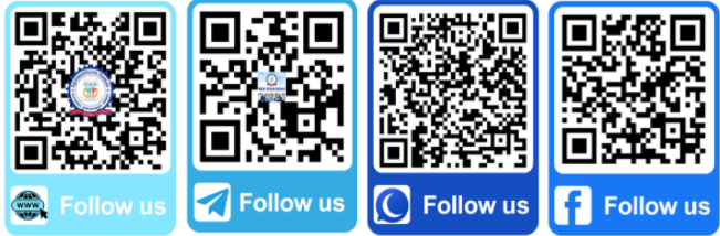
សូមស្កេនដើម្បីទទួលបានព័ត៌មានស្តីពីឱកាសការងារ